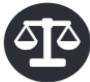
Certification and law