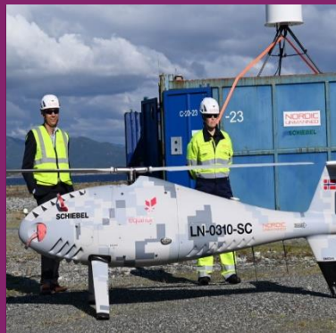
2022-2023 Avansert bruk