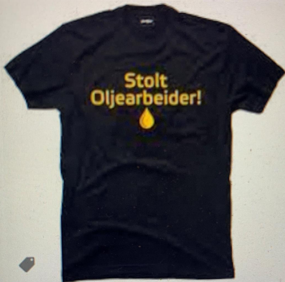
Stolt Oljearbeider! Herre norskhumor.no · På lager